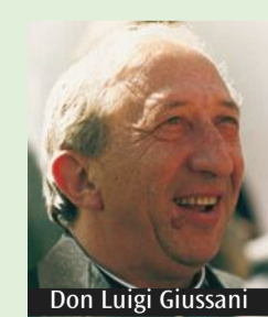
Don Luigi Giussani

In occasione del 16° anniversario della morte del Servo di Dio don Luigi Giussani (22 febbraio 2005) e del 39° del riconoscimento pontificio della Fratemità di Comunione e Liberazione (11 febbraio 1982), lunedì 1 marzo una celebrazione eucaristica sarà presieduta dall'arcivescovo, monsignor Mario Delpini, nel Duomo di Milano alle 19.30. Diretta su Chiesa Tv (canale 195 del digitale terrestre), www.chiesadimilano.it , youtube.com/chiesadimilano ; omelia in differita alle 20.30 su Radio Mater. Centinaia di Messe verranno celebrate in Italia e nel mondo, presiedute da cardinali e vescovi (elenco su www.donline.org ). La modalità della partecipazione alle celebrazioni dipende dalle disposizioni anti-Covid in vigore in ogni nazione, e può variare da città a città.