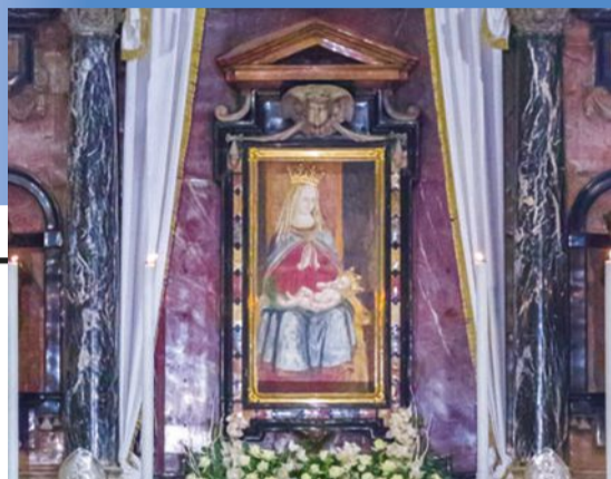
L'interno del santuario della Madonna delle lacrime a Treviglio